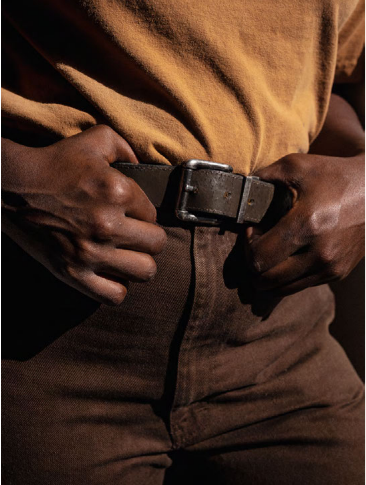
LINKS: „Belt“, 2020/21 RECHTS: „animal“, 2019/21