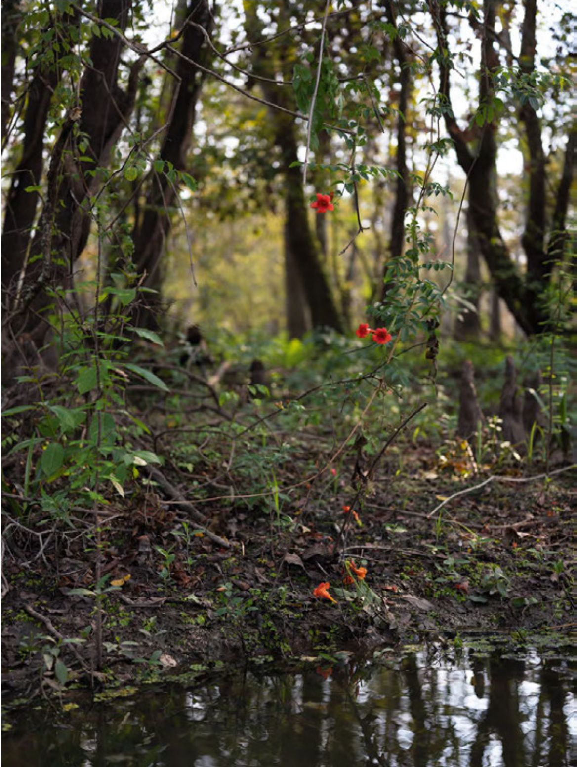
LINKS: „Swamp Flower“, 2020