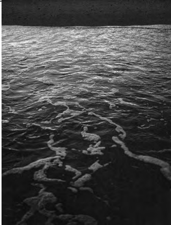
„Ascension (Fire Island)“, 2019/21

Der ambivalente Charakter der Fotografie: Sie kann sichtbar machen, was sonst marginalisiert oder vergessen würde, doch läuft sie dabei immer Gefahr, ihren Gegenstand zu exponieren. Elle Pérez, geboren 1989 in der Bronx, New York, scheint diese Lektion früh gelernt zu haben. Im Alter von zwölf begann Pérez, der sich als transsexuell identifiziert und mit dem Pronomen „they“ angesprochen werden möchte, die queere Punkszene der Bronx zu fotografieren. In den folgenden zehn Jahren entstanden mehr als 20000 Aufnahmen, und doch bestand Pérez' erste Soloausstellung bei der Galerie 47 Canal aus gerade einmal neun Bildern. Sie wollte dokumentieren,