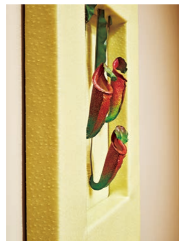
《明日が来れば》(2016) ドイツのカッセル市フリデリシアム美術館で開催された個展「ジャングル・ストリップ」(2016)の中の進花シリーズの1点。鳥の皮膚を連想させるシリコンのフレームにアマゾンの熱帯植物をモデルにした樹脂の花が妖艶。