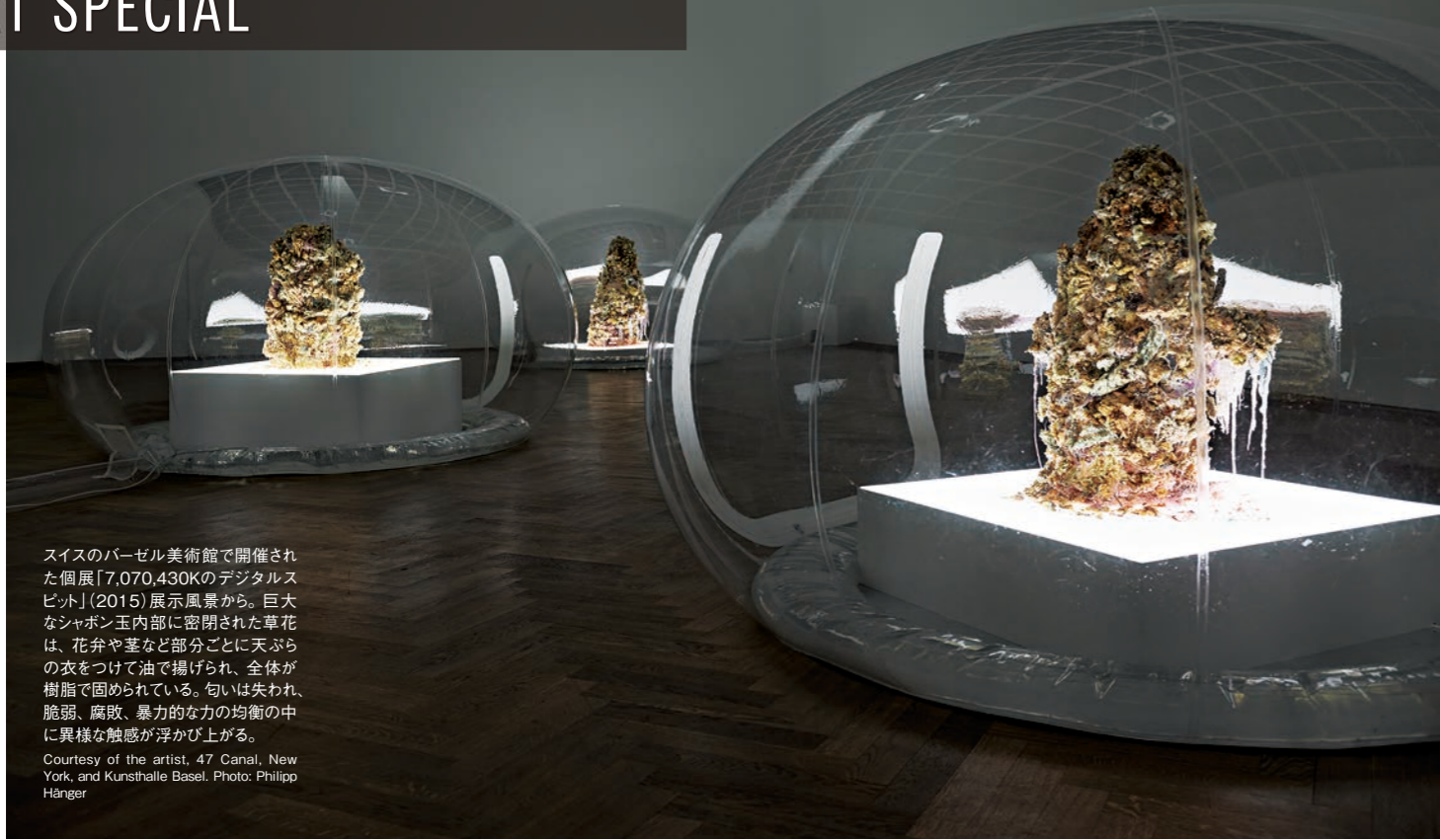
スイスのパーゼル美術館で開催された個展「7,070,430Kのデジタルスピット」(2015)展示風景から。巨大なジャボン玉内部に密閉された草花は、花弁や茎など部分ごとに天ぶらの衣をつけて油で揚げられ、全体が樹脂で固められている。匂いは失われ、脆弱、腐敗、暴力的な力の均衡の中に異様な触感が浮かび上がる。