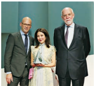
ヒューゴ・ボス賞記念のオブジェを手にするアニカ・イーを囲んでヒューゴ・ボスCEOのマーク・ランガー(左)とグッゲンハイム美術館館長リチャード・アムストロング。受賞記念の展覧会は、タワー館5階を会場に4月21日~7月5日開催。www.guggenheim.org